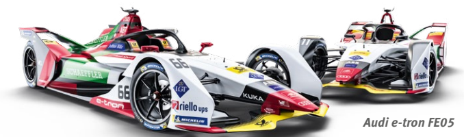
Audi e-tron FE05

Punktesystem 1. 25 Pkt. 2. 18 Pkt. 3. 15 Pkt. 4. 12 Pkt. 5. 10 Pkt. 6. 8 Pkt. 7. 6 Pkt. 8. 4 Pkt. 9. 2 Pkt. 10. 1 Pkt.