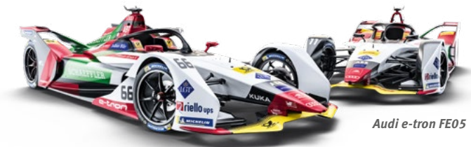
Audi e-tron FE05

Punktesystem 1. 25 Pkt. 2. 18 Pkt. 3. 15 Pkt. 4. 12 Pkt. 5. 10 Pkt. 6. 8 Pkt. 7. 6 Pkt. 8. 4 Pkt. 9. 2 Pkt. 10. 1 Pkt.